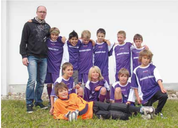
TSV-Burgberg E-2 Jugend: Ungeschlagener Meister 2011.